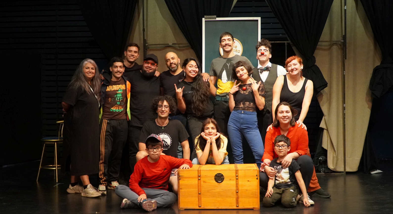
Estreno en Teatro Finis Terrae, abril 2024